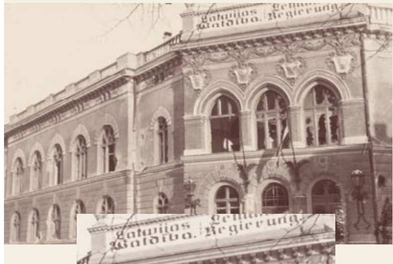
Skats uz Latvijas valdības ēku pēc cīņas ar bermontiešiem (1919. gada novembris)